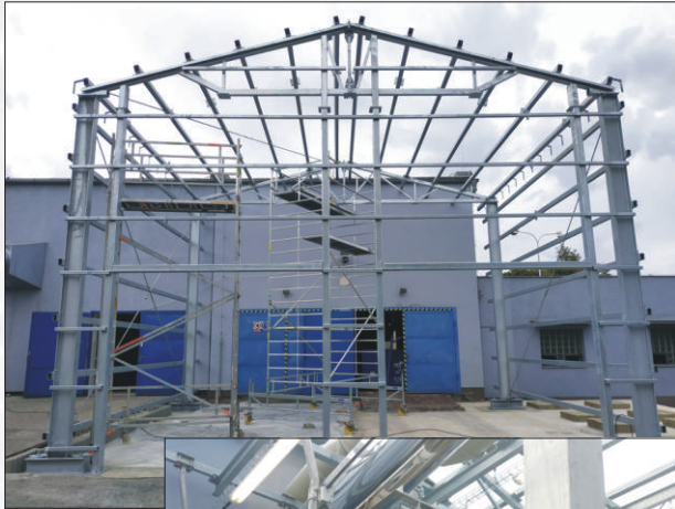
Konstrukce ocelové haly