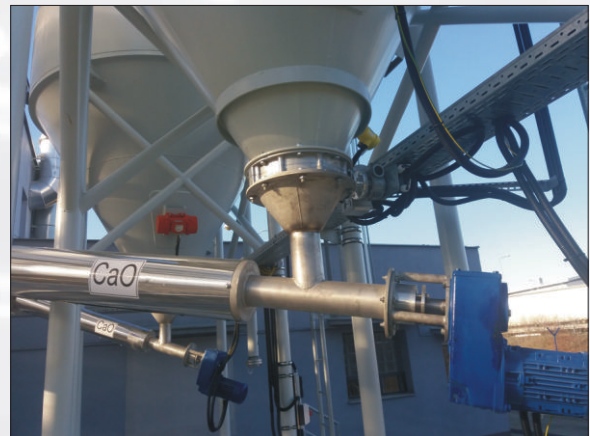
Detail síla CaO