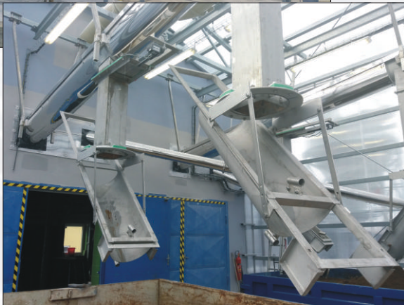
Doprava kalu do kontejneru